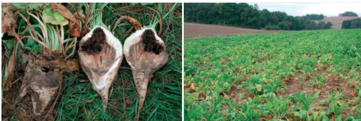
Ditylenchus dipsaci an Zuckerrüben