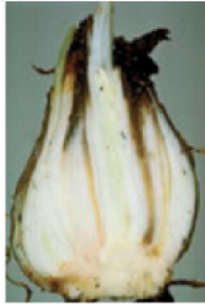
befallene Narzissenzwiebel (CSL, York)