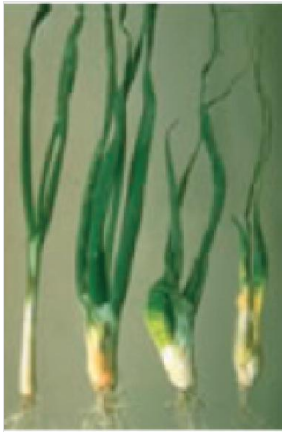
geschädigte Knoblauchpflanzen