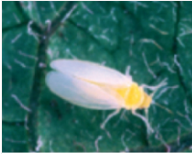
Adultes Tier