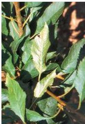
Blattverschmälerung an Süßkirsche