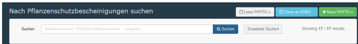
Abbildung 4: TRACES Schaltflächen für PHYTOs

Sie werden dann nach 3 Kriterien gefragt, um nachzuweisen, dass das PHYTO trotzdem zu Ihnen gehört. Der/die Verantwortliche für die Sendung oder die Grenzkontrollstelle bekommen diese Informationen durch Kommunikation mit Ihrem/Ihrer Handelspartner/in. Dann kann die Klonierung begonnen werden.