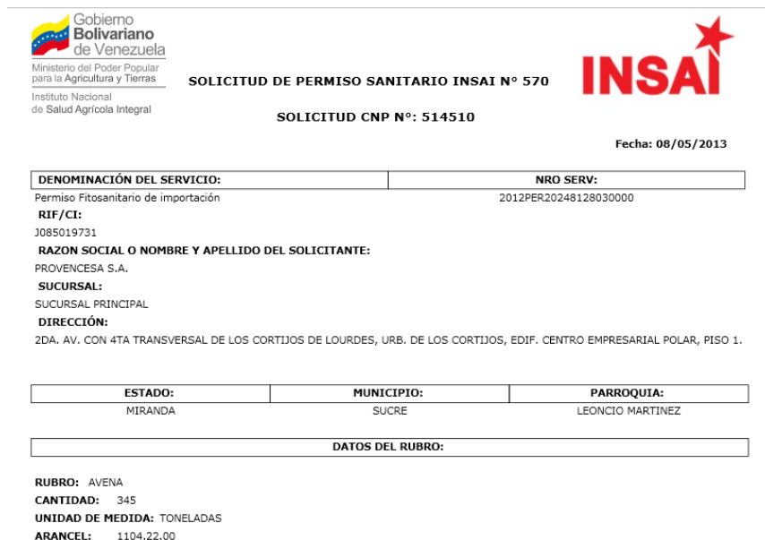
Abbildung Nr. 9. Formular-008/ CNP

Imprimir forma-008 [Formular 008 drucken]: Das INSAI-Formular für den Genehmigungsantrag wird mit allen eingegebenen Angaben angezeigt.