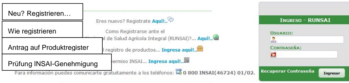
Abbildung Nr. 2. Eingangsseite zum System RUNSAI

...über http://www.insai.gob.ve . Suchen Sie den Menüpunkt Sistemas y Servicios und wählen Sie im Dropdown-Menü RUNSAI , dann die Schaltfläche Ir al Sistema RUNSAI [Zu RUNSAI]. Dann öffnet sich ein Formular ( http://runsai.insai.gob.ve/ ) mit dem Antrag auf Zugang bzw. dem Zugang zur RUNSAI-Hauptseite.