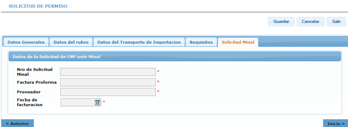
Abbildung Nr. 8. Abschnitt Antrag MINAL

Wurden alle Angaben eingegeben, klicken Sie auf die Schaltfläche >Guardar< oben auf dem Bildschirm, um die Antragsdaten zu speichern.