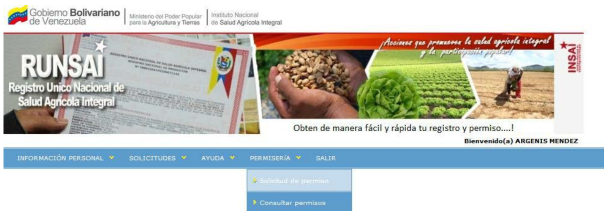
Abbildung Nr. 3. Hauptseite System RUNSAI

Für die Antragstellung... wählen Sie den Menüpunkt Permiseria [Genehmigung], der auf der Hauptseite des Systems angezeigt wird. Wählen Sie im Dropdown-Menü die Option Solicitud de Permiso [Antrag auf Genehmigung]. Es wird ein Formular geöffnet. Dort können Sie alle zur Genehmigung gehörenden Angaben eingeben. Es enthält mehrere Abschnitte, die alle für die Antragstellung auszufüllen sind.