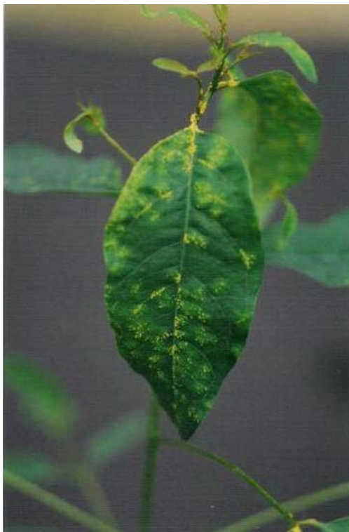
Bild 4: Symptome eines Befalls mit Puccinia psidii auf der Blattoberseite