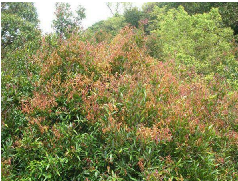
Bild 6: Befall mit Puccinia psidii an Syzygium jambos (Forest & Kim Starr, United States Geological Survey, Biological Resources Division (Anonym, 2009))