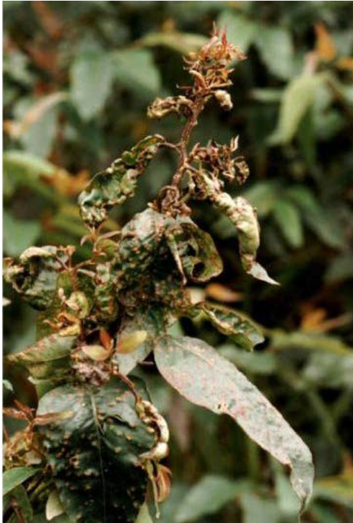
Bild 5: Starker Befall mit Puccinia psidii an Eukalyptus (PaDIL( www.padil.gov.au ) (Anonym, 2009))