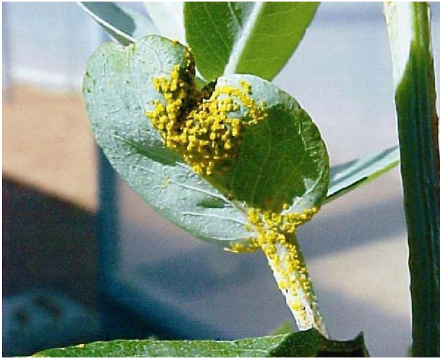
Bild 3: Rostsporen auf der Unterseite von Eukalyptusblättern (Forest pathology and Genetics of Plant Pathogen Interactions Laboratory, Federal University of Viçosa (Anonym, 2009))