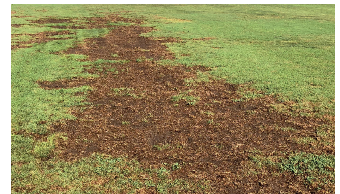
4. Schaden an einem Fußballplatz durch die Larven des Japankäfers im August (Mendrisio, Tessin, Schweiz)

Zierpflanzen: Rosa sp. (Rose), Wisteria sp. (Blauregen), Calluna vulgaris (Heide), Dahlia sp., Aster sp., Zinnia sp., Syringa sp. (Flieder), Virburnum sp. (Schneeball) u.a.