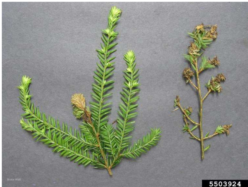
Abbildung 1: Abgestorbene Triebspitzen an Tsuga canadensis