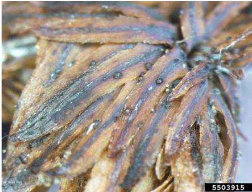
Abbildung 4: Pycnidien von S. tsugae auf infizierten Nadeln