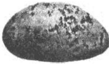
Abbildung 4. Rhizoctonia (10 % der Knollenoberfläche befallen)

Für die Bewertung des Befalls mit Silberschorf werden nur Knollen berücksichtigt, die weich und schrumpelig sind und beschädigte Augen aufweisen.