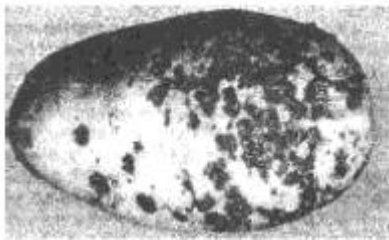
Abbildung 1. Netzschorf (33,3 % der Knollenoberfläche befallen)

Abbildung 2. Netzschorf (33,3 % der Knollenoberfläche befallen)