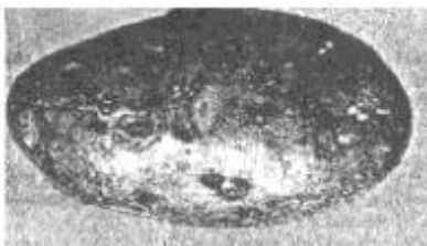
Abbildung 2. Pulverschorf (10 % der Knollenoberfläche befallen)

Abbildung 3. Pulverschorf (10 % der Knollenoberfläche befallen)