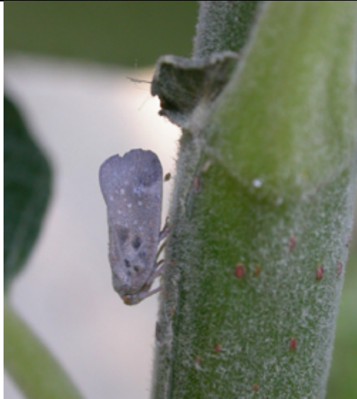
Abb. 1: Metcalfa pruinosa, adultes Tier