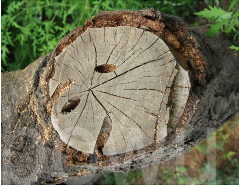
Abb. 3: Schadbild

http://tupian.hudong.com/s/%E6%A1%83%E7%BA%A2%E9%A2%88%E5%A4%A9%E7%89%9B/xgtupian/1/6