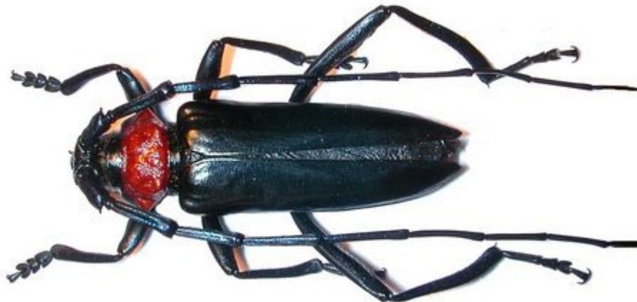
Abb. 2: Imago. http://pest.ceris.purdue.edu/pest.php?code=INALFJA

http://tupian.hudong.com/a3_26_82_01300000085669121076821044108_jpg.html